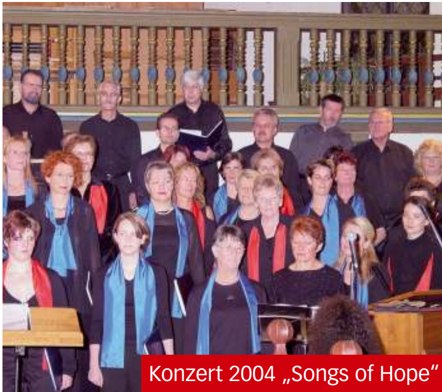
Konzert 2004 „Songs of Hope“

2007 machten wir dann mit einem Reigen internationaler Weihnachtslieder eine imaginäre Reise um die Erde, die durch passende Bilder auf einer Leinwand ergänzt wurden.