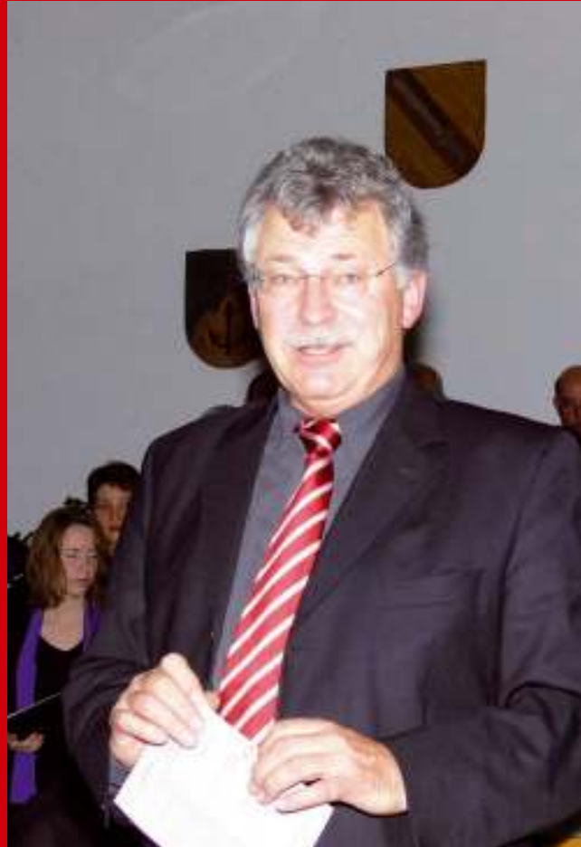
Konzert „Ein Abend bei den Mozarts“