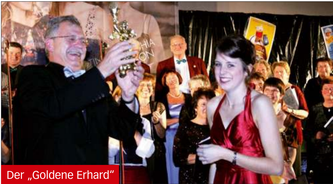
Der „Goldene Erhard“