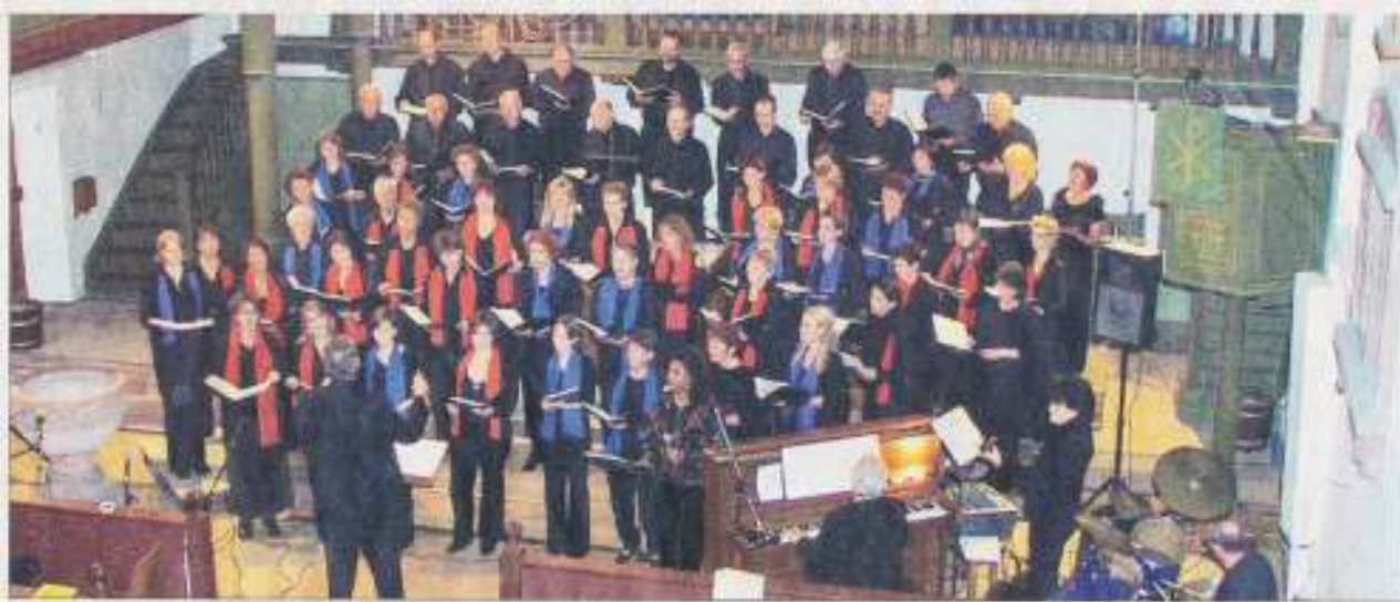
So begeistert kann Chormusik sein – ein echtes Highlight zum Ausklang des Jubiläumjahres gelang dem Sängerbund mit seinem Gospelkonzert in der voll besetzten Christuskirche.