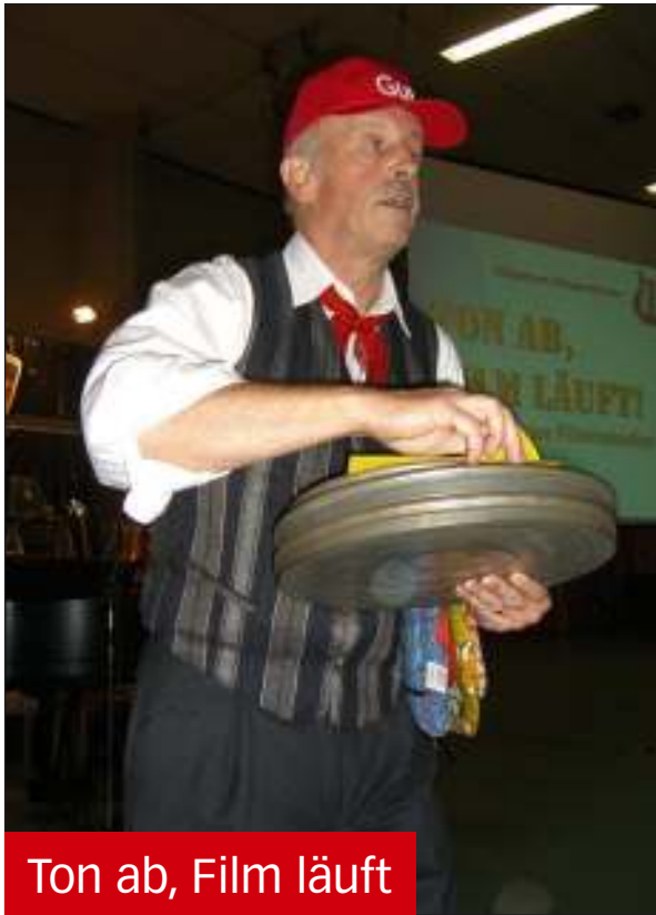
Ton ab, Film läuft