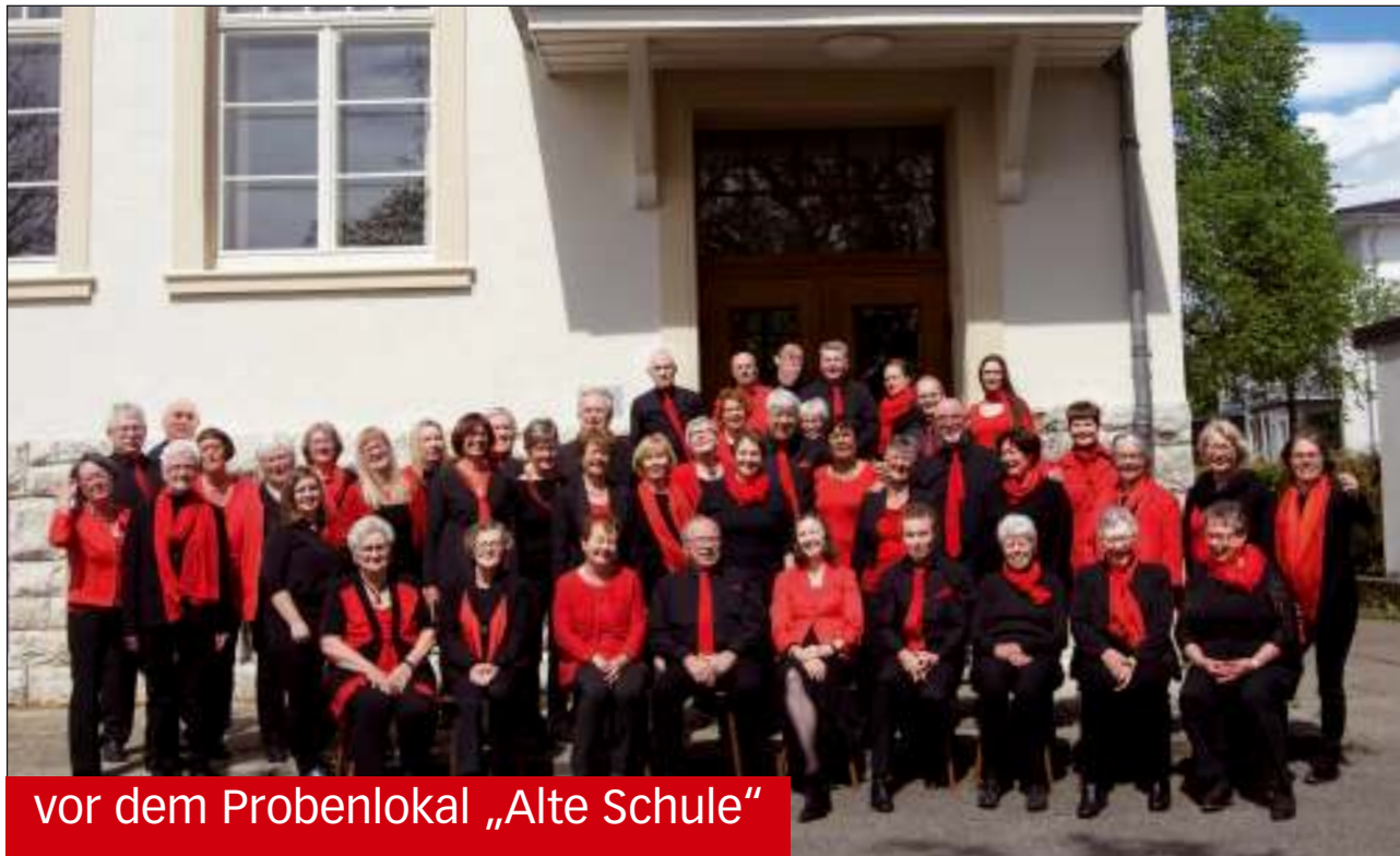
vor dem Probenlokal „Alte Schule“